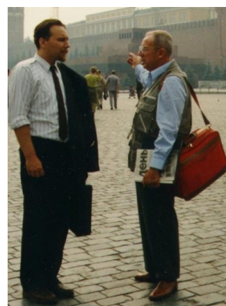
Dugin y Thiriart

Y como profesor, el carismático ruso es además muy popular entre sus estudiantes. Cuando Dugin da lecciones en la universidad, la sala siempre se llena al máximo. A menudo incorpora en sus discursos bombásticas instalaciones de vídeo. Mientras Dugin habla a su público, hay una pantalla tras él donde se ven llamaradas de fuego a gran altura, o donde se muestran explosiones.