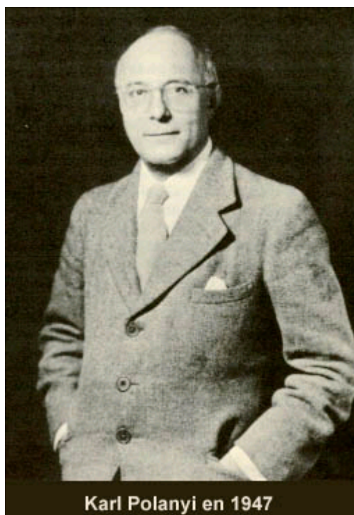
Karl Polanyi en 1947

Es precisamente esta fusión la que impide conocer cuál ha sido el lugar de la economía en la historia de las diferentes sociedades en las que han existido gran variedad de instituciones diferentes de los mercados en las que estaba integrada la actividad económica del sustento y que, por tanto, no pueden ser explicadas por un conjunto de conceptos analíticos que se ajustan tan sólo a la economía de mercado 4 , es decir, no pueden ser explicadas por el significado formal de lo económico, pero sí por el sustantivo, que permitiría conocer cómo se organizaba realmente el sustento sin elementos de mercado y acción racional.