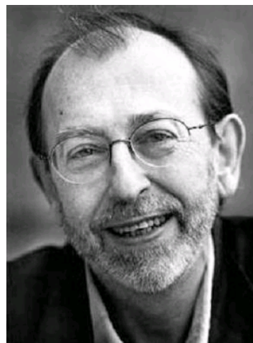
Alain de Benoist