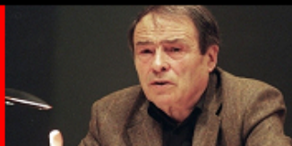
Pierre Bourdieu La mujer objeto de la dominación masculina